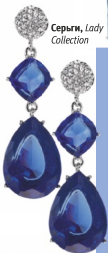
Серьги, Lady Collection