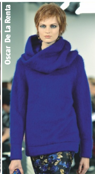
Oscar De La Renta